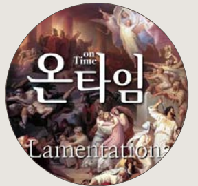
성경 통독 묵상 온타임 온타임은 매일 교회 홈페이지에서도 영상으로 만나볼 수 있다.