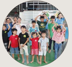
청년선교국 해외선교 후원 모집 2월 18일~25일 진행되는 베트남 선교를 위한 후원을 받고 있다.