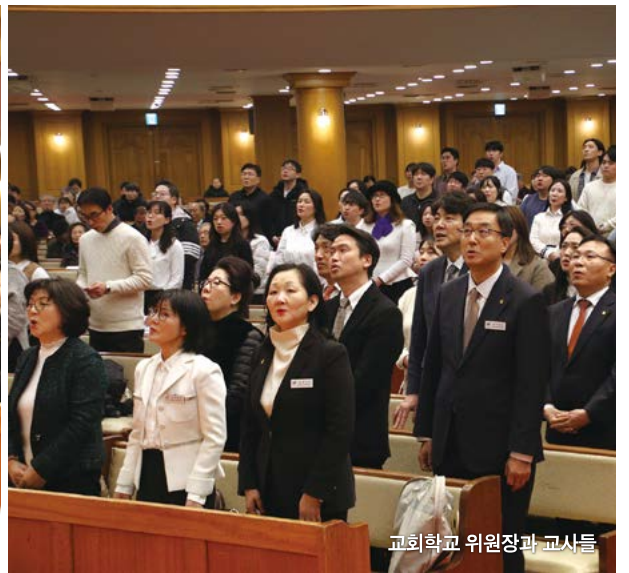
교회학교 위원장과 교사들