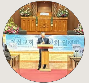
여선교회총연합회 2월 월례회 2월 2일(주일) 여선교회총연합회 월례회가 본당에서 열렸다.