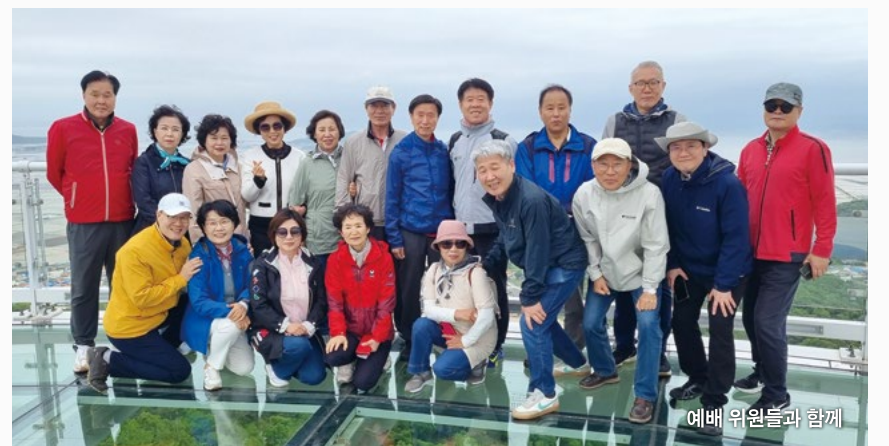
예배 위원들과 함께